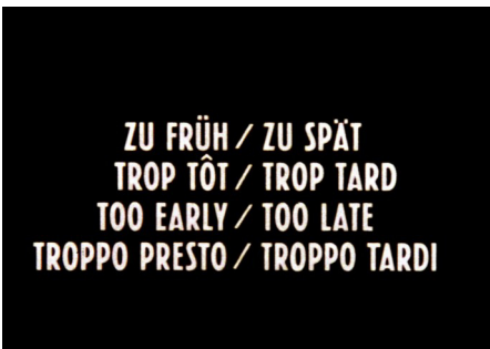
Danièle Huillet und Jean-Marie Straub Filmstill Zu Früh / Zu Spät , 1980/81