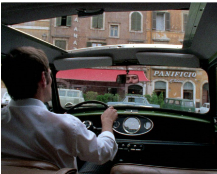
Danièle Huillet und Jean-Marie Straub Filmstill Geschichtsunterricht , 1972