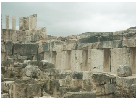
Oraib Toukan Videostill Palace of the Slave , 2017 2-Kanal-Videoinstallation, 10 Min.