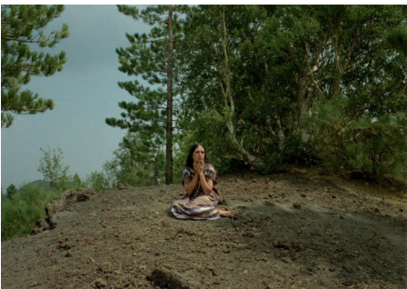
Danièle Huillet und Jean-Marie Straub Filmstill Danièle Huillet in Schwarze Sünde , 1988