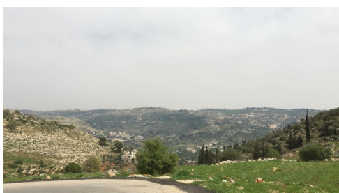
Ala Younis This land first speaks to you in signs , 2017 Verschiedene Materialien © Ala Younis