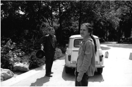
Danièle Huillet und Jean-Marie Straub, in den Gärten des Palais de Chaillot, Paris, 1990er Jahre

Honorarfreie Nutzung ausschließlich im Rahmen der aktuellen Berichterstattung zur Ausstellung. Nutzung auf Social-Media-Plattformen nur auf Anfrage gestattet. Nennung der Credits zwingend erforderlich. Die Abbildungen dürfen nicht modifiziert, beschnitten und überdruckt werden – etwaige Vorhaben bedürfen der schriftlichen Zustimmung. Eine Weitergabe an Dritte ist nicht erlaubt. Die Pressefotos sind 4 Wochen nach Ablauf der Ausstellung aus allen Onlinemedien zu löschen. Bitte schicken Sie uns einen Beleg der Veröffentlichung. Zugangsdaten zum Download im Pressebereich von www.adk.de bitte erfragen unter Tel. 030 200 57-1514 oder per E-Mail an presse@adk.de