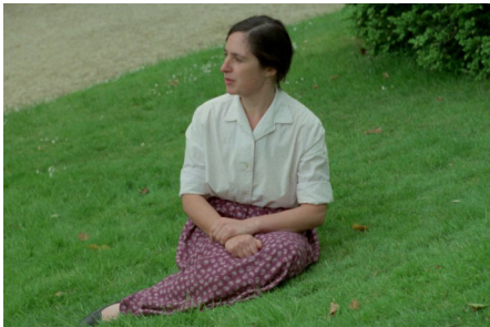
Danièle Huillet und Jean-Marie Straub Filmstill Danièle Huillet in Toute révolution est un coup de dés , 1977