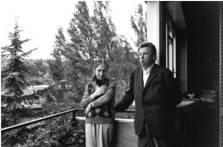
Danièle Huillet und Jean-Marie Straub, auf dem Balkon ihres Hauses in Rom, 1996