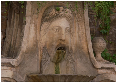
Luisa Greenfield Videostill History Lessons By Comparison , 2017 Video, 51 Min. © Luisa Greenfield

Honorarfreie Nutzung ausschließlich im Rahmen der aktuellen Berichterstattung zur Ausstellung. Nutzung auf Social-Media-Plattformen nur auf Anfrage gestattet. Nennung der Credits zwingend erforderlich. Die Abbildungen dürfen nicht modifiziert, beschnitten und überdruckt werden – etwaige Vorhaben bedürfen der schriftlichen Zustimmung. Eine Weitergabe an Dritte ist nicht erlaubt. Die Pressefotos sind 4 Wochen nach Ablauf der Ausstellung aus allen Onlinemedien zu löschen. Bitte schicken Sie uns einen Beleg der Veröffentlichung. Zugangsdaten zum Download im Pressebereich von www.adk.de bitte erfragen unter Tel. 030 200 57-1514 oder per E-Mail an presse@adk.de