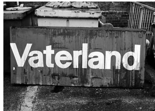
KLAUS STAECK, VATERLAND, 1991