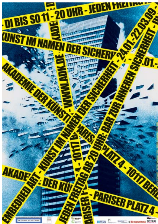
Gunter Rambow Utopie Dynamit. Tatort Bankfurt 1976/2008 © Rambow 1976/2008