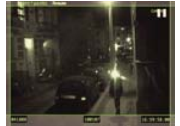
adk_embedded art_u.r.a._irasc 2 U.R.A./FILOART Face Care & Protect/I.-R.A.S.C. 2, 2008 © U.R.A./FILOART 2008