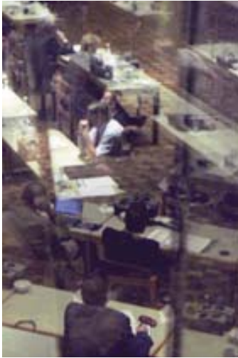
adk_embedded art_specker_future Heidi Specker Future Security Conference, 2008

Kostenfreie Verwendung ausschließlich für die aktuelle Berichterstattung im Kontext der Ausstellung und unter Nennung des Copyrights. Belegexemplar erwünscht. Passwort zum Download im Pressebereich von www.adk.de bitte erfragen unter Tel. 030 200 57-1514