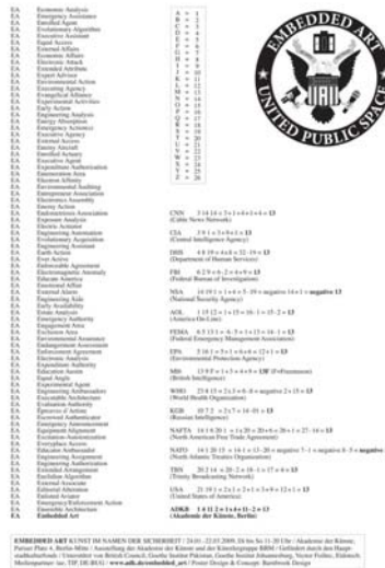
Jonathan Barnbrook EMBEDDED ART United Public Space © Jonathan Barnbrook 2008