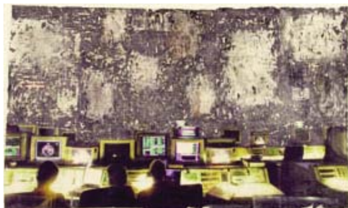
adk_embedded art_kennard+phillipps Peter Kennard & Cat Picton Phillipps Control Room, 2006 © Peter Kennard & Cat Picton Phillipps 2008