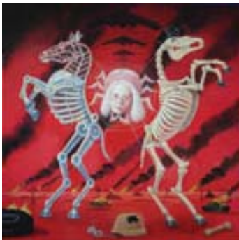
adk_embedded art_morris_five moritz® Janet morris . Aus der Serie: Five Peace Monsters © moritz® 2008