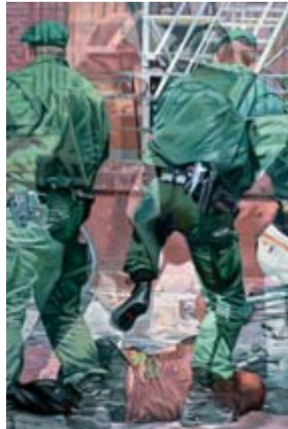
adk_embedded art_schneider-von maydell_freistoss Angelika Schneider-von Maydell Freistoß aus der Reihe: Desasters, 2008 © Angelika Schneider-von Maydell 2008