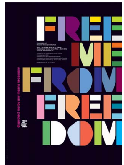
Neville Brody free me from freedom © Neville Brody 2008