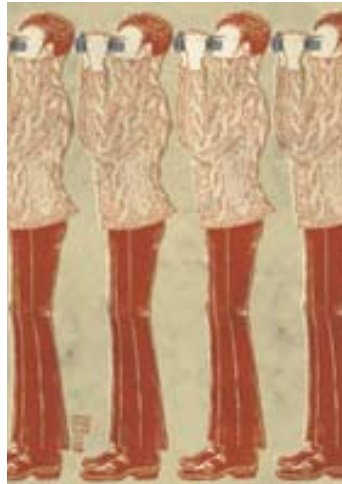
adk_embedded art_shimizu_rot Yuko Shimizu Ohne Titel © Yuko Shimizu 2008