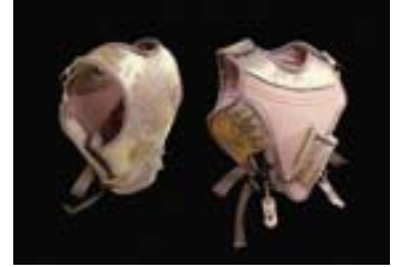
adk_embedded art_coetzer_bulletproof Jacques Coetzer Smart Casual Bulletproof © Jacques Coetzer 2008