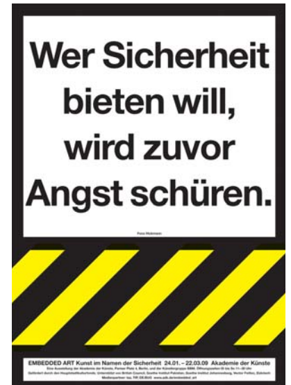
Fons Hickmann Wer Sicherheit bieten will... © Fons Hickmann 2008