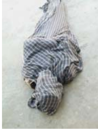
adk_embedded art_zueck_defence Christina Zück Defence Phase II Karachi, 2008