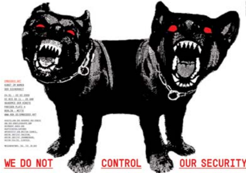
Omar Vulpinari we do not control our security

Ausstellung der Akademie der Künste und der Künstlergruppe BBM 24.01.-22.03.2009 Pariser Platz 4, 10117 Berlin-Mitte