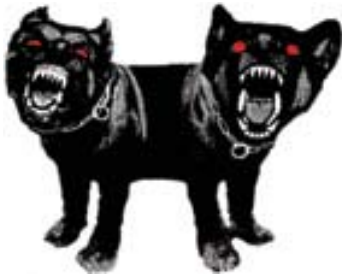
adk_embedded art_vulpinari_dog Illustration: Omar Vulpinari © Omar Vulpinari, 2008