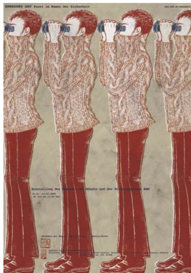
Yuko Shimizu Ohne Titel © Yuko Shimizu 2008