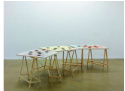
AdK_Hatoum_Cities 3-D Cities, 2008-2010 Stadtpläne, gedruckt, Holz, versch. Maße (ca. 78 x 362 x 180 cm) © Mona Hatoum