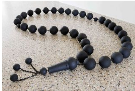
AdK_Hatoum_Beads Worry Beads , 2009 Patinierte Bronze, Weichstahl, variable Größe © Mona Hatoum