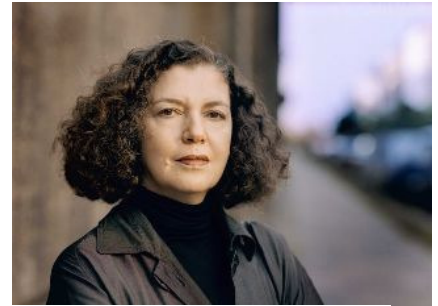
AdK_Hatoum_Portraet Mona Hatoum Fotograf Jim Rakete © Mona Hatoum