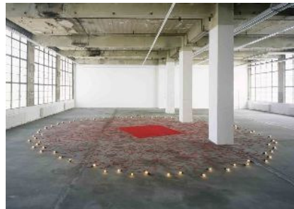
AdK_Hatoum_Undercurrent Undercurrent (red) , 2008 Stoffbezogenes Kabel, Glühbirnen, Dimsteuerung, 8 x 1070 x 1070 cm © Mona Hatoum