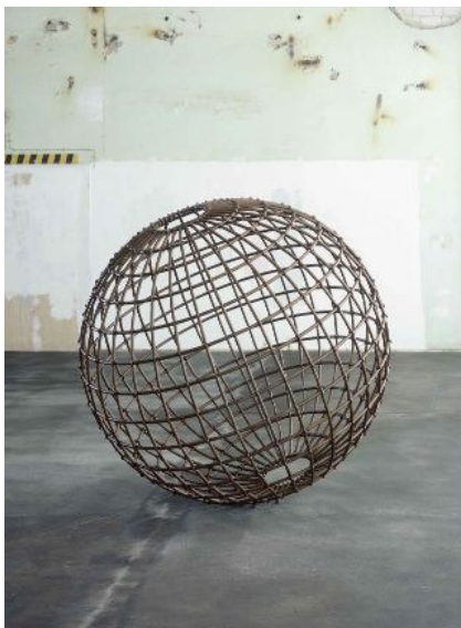
AdK_Hatoum_Globe Globe , 2007 Weichstahl, 170 cm Durchmesser Fotograf Holger Niehaus Courtesy Galerie Max Hetzler, Berlin © Mona Hatoum