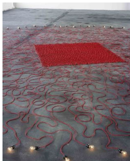
AdK_Hatoum_Undercurrent_detail Undercurrent (red) , 2008 Stoffbezogenes Kabel, Glühbirnen, Dimsteuerung, 8 x 1070 x 1070 cm Fotograf Jörg von Bruchhausen Courtesy Galerie Max Hetzler, Berlin © Mona Hatoum