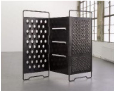
AdK_Hatoum_Paravent Paravent , 2008 Schwarz brüniertes Stahl, 302 x 211 x 5 cm Fotograf Holger Niehaus Courtesy Galerie Max Hetzler, Berlin © Mona Hatoum

Kostenfreie Verwendung ausschließlich für die aktuelle Berichterstattung im Kontext der Ausstellung und unter Nennung des Copyrights. Pressefotos auf Anfrage unter 030 200 57-15 14 oder presse@adk.de