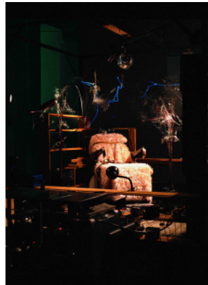
adk_Cardiff_Miller_Killing_Machine_detail.jpg Janet Cardiff & George Bures Miller The Killing Machine, 2007

Mixed-Media-Installation mit elektronisch gesteuerter Robotertechnik und Ton, 4:40 Min. 300 × 400 × 250 cm