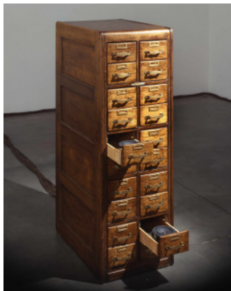
adk_Cardiff_Miller_Cabinet_of_Curiousness.jpg Janet Cardiff & George Bures Miller The Cabinet of Curiousness, 2010

Mixed-Media-Installation mit elektronisch gesteuerter Robotertechnik und Ton, 4:40 Min. 300 × 400 × 250 cm