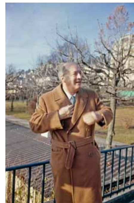
Abbildungen (UZS von links oben)