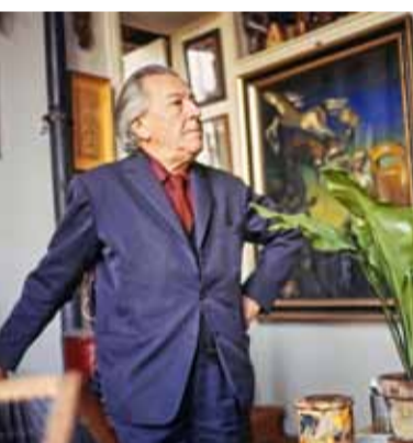
Gisèle Freund Fotografische Szenen und Porträts 23. Mai bis 10. August 2014

Eine Ausstellung der Akademie der Künste, der Hamburger Stiftung zur Förderung von Wissenschaft und Kultur und des IMEC (Institut Mémoires de l'édition contemporaine), Paris