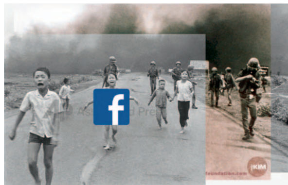
Eran Schaefer Letters From the Editor #18 (Facebook zensiert das Foto des Napalm- Angriffs auf Trang Bang, 13. September 2016), 2017, digitale Fotocollage © Eran Schaefer / VG Bild-Kunst, Bonn 2017

tions in her work on artistic and social parameters. Her creative interaction with the political – not quoting, not using, but 'political creation' – is what particularly makes the 2017 Käthe Kollwitz prizewinner stand apart.