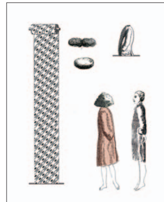
Ulrike Grossarth , descending and ascend- ing, Warschau/Lublin/Dresden 2015/16, Siebdruck, Buntstift © Ulrike Grossarth

Für junge Kunstfreunde, kostenlos an der Museumskasse erhältlich.