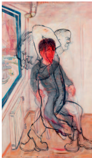
Gustav Kluge Abbruch der Beziehungen, 2011, Öl auf Leinwand © Gustav Kluge / Galerie Michael Haas Foto: Dirk Masbaum