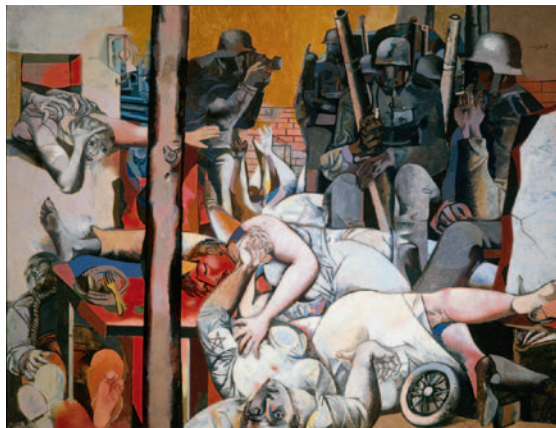
Willi Sitte Massaker II, 1959, Öl auf Hartfaser

Käthe Kollwitz war von 1919 bis zu ihrem von den Nationalsozialisten erzwungenen Austritt 1933 Mitglied der Preußischen Akademie der Künste. Mit ihrer Berufung wurde ihr der Professorentitel verliehen. Ab 1928 übernahm sie die Leitung einer Graphikklassen und gehörte als Vorsteherin eines Meisterateliers auch dem Senat der Akademie an. Zusätzlich war Kollwitz langjähriges Mitglied der Kommission, die Programm und Künstler der halbjährlich stattfindenden Akademieausstellungen festlegte. Auch sie selbst war hier mit zahlreichen Werken vertreten. Eine Präsentation innerhalb der Kölner Kollwitz Sammlung zeigt ihre Ausstellungsbeteiligungen.