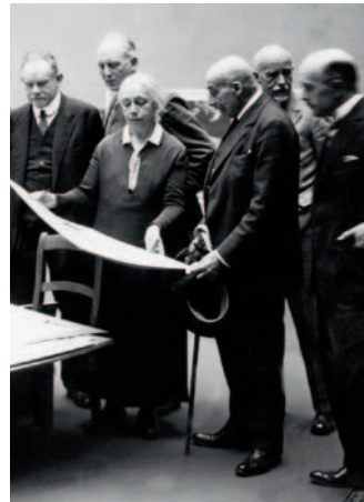
Käthe Kollwitz , Jury-Sitzung in der Preußischen Akademie der Künste 1927, Nachlass Kollwitz © Käthe Kollwitz Museum Köln

Kosten: 7,50 € / 4,50 € (inkl. Ausstellung)