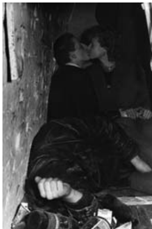
Übergang_Schulze-Eldow_Paar Gundula Schulze-Eldow aus: Im Herbstlaub des Vergessens, Berlin 1983/2009, Ton-Bild-Collage © Gundula Schulze-Eldow