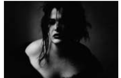
Übergang_Marquardt_Frau Sven Marquardt Ohne Titel, 1988 © Sven Marquardt