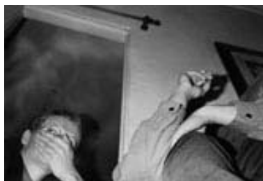
Übergang_Sewcz Maria Sewcz aus: Ins Auge gefasst, 1985