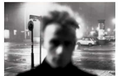
Übergang_Buchwald_1 Kurt Buchwald aus: Ein Streifen Tag – ein Streifen Nacht, Berlin 1987/88 © Kurt Buchwald