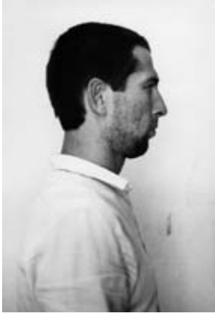
Übergang_Paris_Mann_links Helga Paris Bernd Wagner I, 1983