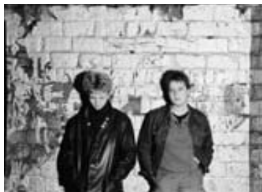
Übergang_Schäfer_Punk Rudolf Schäfer Punk aus: Reproduktion, 1983 Platin-Palladiumdruck © Rudolf Schäfer