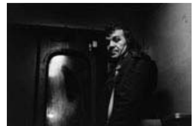
Übergang_Oltmanns_Hilbig Dietrich Oltmanns aus: Wolfgang Hilbig, Meuselwitz 1983 © Dietrich Oltmanns