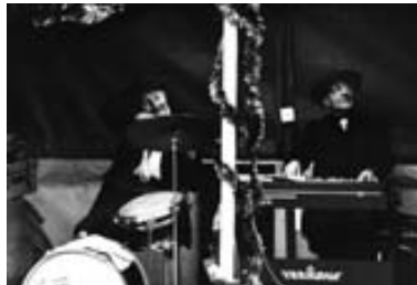
Übergang_Schulze-Eldow_Musiker Gundula Schulze-Eldow aus: Im Herbstlaub des Vergessens, Berlin 1983/2009, Ton-Bild-Collage © Gundula Schulze-Eldow