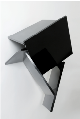
adk10_WWK_0089 Ohne Titel. 2008 MDF-Platte, Schellackpolitur, 96 x 69 x 67 cm © Wolfgang Wagner-Kutschker