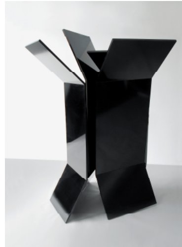
adk10_WWK_0161 Ohne Titel. 2002 MDF-Platte, Schellackpolitur, 205 x 140 x 95 cm © Wolfgang Wagner-Kutschker