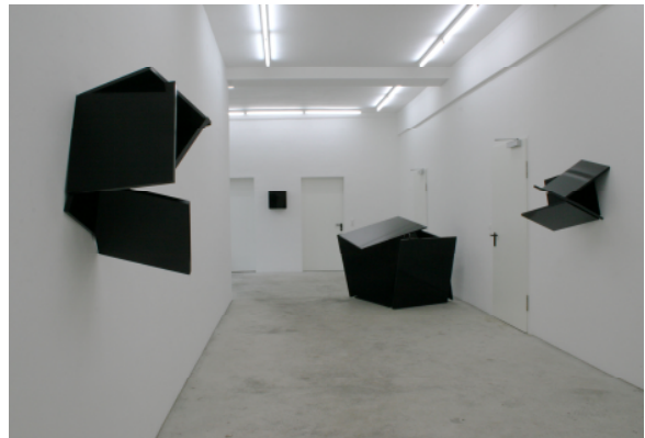
adk10_WWK_2661 Ausstellung im Atelierhaus Friesenstraße, Bremen, 2006