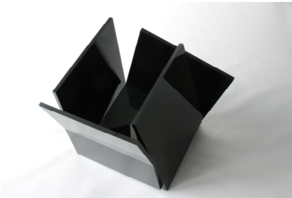
adk10_WWK_0117 Ohne Titel. 2003 Multiplex-Platte, Schellackpolitur, 61 x 67 x 58 cm © Wolfgang Wagner-Kutschker