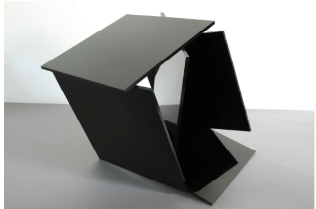
adk10_WWK_0168 Ohne Titel. 2003 MDF-Platte, Schellackpolitur, 98 x 115 x 139 cm © Wolfgang Wagner-Kutschker