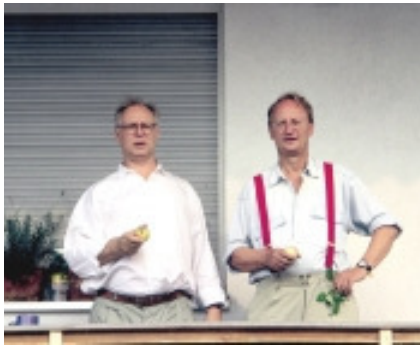
adk_Polke_Staeck_1997 Sigmar Polke und Klaus Staeck, 1997

Passwort zum Download im Pressebereich von www.adk.de bitte erfragen unter Tel. 030 200 57-1514 oder presse@adk.de