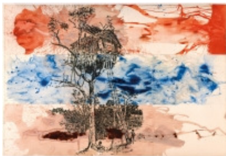
adk_Polke_Kleinbuerger_Baumhaus Sigmar Polke: Baumhaus, aus dem Zyklus „Wir Kleinbürger! Zeitgenossen und Zeitgenossinnen“, 1976 Gouache und Acrylfarbe auf Papier auf Leinwand, 205 x 294,5 cm