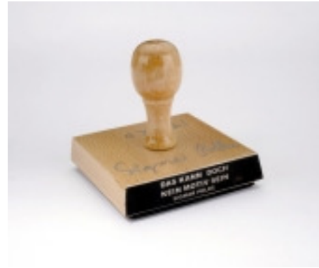
adk_Polke_Stempel Das kann doch kein Motiv sein, 2000 Stempelobjekt, Holz und Gummi, 7 x 7 cm (Stempelfläche), 7,5 x 8 x 8 cm (Stempel) © VG Bild-Kunst