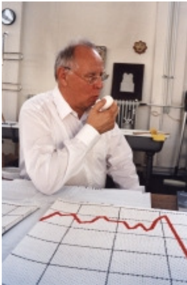
adk_Polke_Portraet_Ei Sigmar Polke mit Ausschnitt „Unerwünschte Geschenke“, 2003 Fotografie, 21 x 30 cm Foto: Klaus Staeck Edition Staeck © VG Bild-Kunst