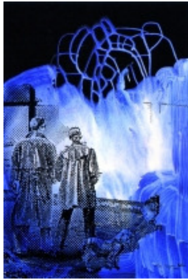
adk_Polke_Preisvergleich Sigmar Polke: Preisvergleich, 2001 Offsetlithographie und Siebdruck auf Schoellerhammers-Karton, 100,5 x 69 cm Edition Staeck © VG Bild-Kunst