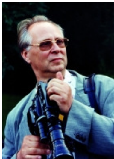
adk_Polke_Portraet_Kamera Sigmar Polke, 1995 Fotografie, 21 x 30 cm Foto: Klaus Staeck Edition Staeck © VG Bild-Kunst