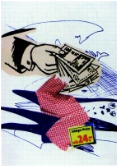
adk_Polke_Bargeld Sigmar Polke: Bargeld lacht, 2002 Offsetlithographie, Siebdruck auf Karton, 70 x 50 cm Edition Staeck

Passwort zum Download im Pressebereich von www.adk.de bitte erfragen unter Tel. 030 200 57-1514 oder presse@adk.de