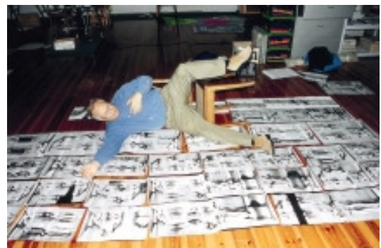
adk_Polke_Portraet_2000 Sigmar Polke in seinem Kölner Atelier, 2000 Fotografie, 21 x 30 cm Foto: Klaus Staeck Edition Staeck © VG Bild-Kunst