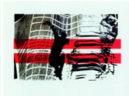
adk_Polke_Fall Sigmar Polke: Der zweite Fall, 1995 Serigraphie auf Schoellershammer-Karton, 43 x 61 auf 55 x 75 cm Edition Staeck © VG Bild-Kunst