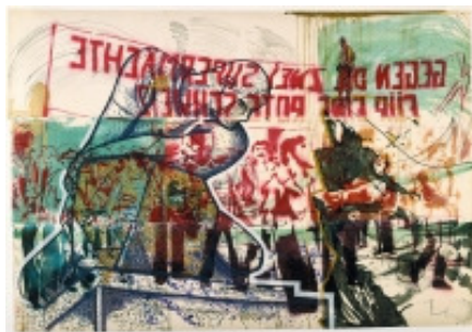
adk_Polke_Kleinbuerger_Giornico Sigmar Polke: Giornico, aus dem Zyklus „Wir Kleinbürger! Zeitgenossen und Zeitgenossinnen“, 1976 Gouache, Goldbronze, Lack- und Acrylfarbe auf Papier auf Leinwand, 206 x 296 cm