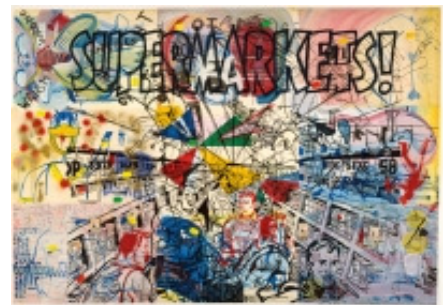
adk_Polke_Kleinbuerger_Supermarkets Sigmar Polke: Supermarkets, aus dem Zyklus „Wir Kleinbürger! Zeitgenossen und Zeitgenossinnen“, 1976 Gouache, Goldbronze, Lack- und Acrylfarbe, Filzstift, Collage auf Papier auf Leinwand, 204 x 291,5 cm