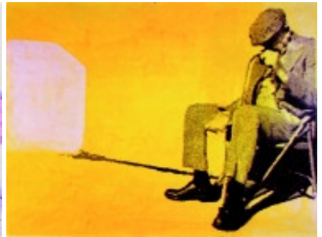
adk_Polke_Blues Sigmar Polke: I got the Blues, 2008 Serigraphie auf Karton, 55 x 75 cm Edition Staeck