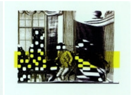
adk_Polke_Stand Sigmar Polke: Der dritte Stand, 1995 Serigraphie auf Schoellershammer-Karton, 43 x 61 auf 55 x 75 cm Edition Staeck © VG Bild-Kunst