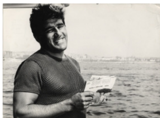
Datei: adk12_Adorf_c_Battista.jpg Mario Adorf Operazione San Gennaro/Opération San Gennaro/ Unser Boss ist eine Dame, I/F/BRD, 1966