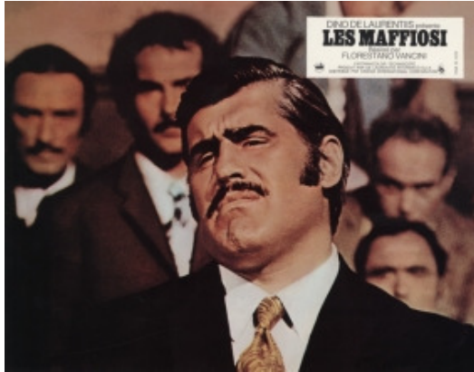
Datei: adk12_Adorf_la_violenza.jpg Mario Adorf La violenza: quinto potere (Gewalt - Die fünfte Macht im Staat), I 1971/72

Veröffentlichung kostenfrei im Rahmen der aktuellen Berichterstattung zur Ausstellung. Nennung der Credits zwingend erforderlich. Belegexemplar erwünscht. Passwort zum Download im Pressebereich von www.adk.de bitte erfragen unter Tel. 030 200 57-1514 oder per E-Mail an presse@adk.de