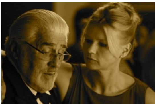
Datei: adk12_Adorf_Ferres.jpg Mario Adorf, Veronica Ferres Die lange Welle hinterm Kiel, 2011