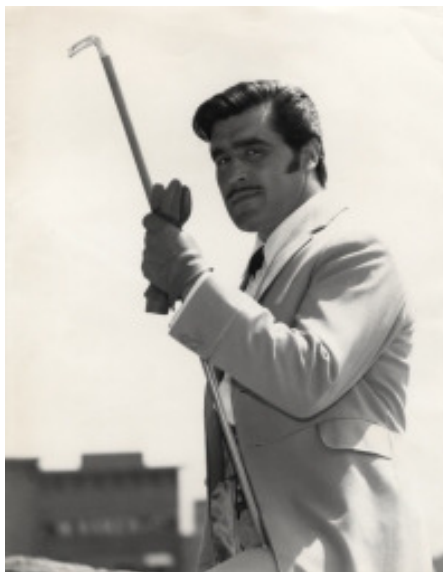
Datei: adk12_Adorf_Goldsucher_von_Arkansas.jpg Mario Adorf Die Goldsucher von Arkansas/Alla conquista dell'Arkansas/Les chercheurs d'or de l'Arkansas, BRD/IF 1964