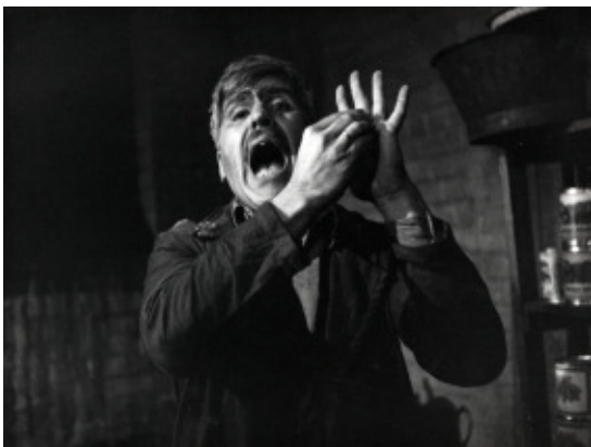
Datei: adk12_Adorf_Blechtrummel.jpg Mario Adorf Die Blechtrummel, 1978/79