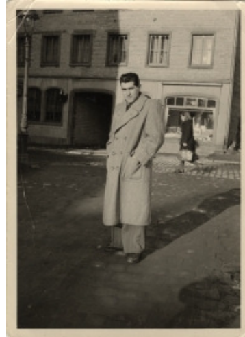
Datei: adk12_Adorf_1951.jpg Mario Adorf, 1951