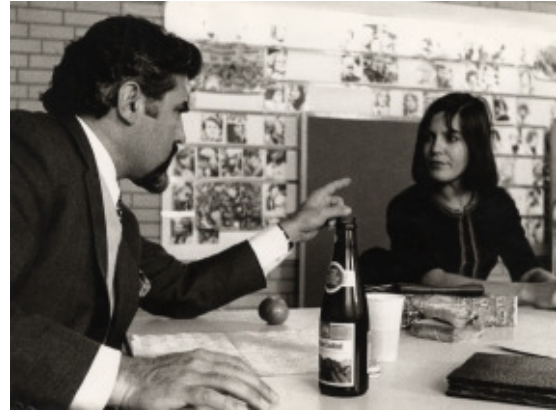
Datei: adk12_Adorf_Katharina_Blum.jpg Mario Adorf, Angela Winkler Die verlorene Ehre der Katharina Blum, BRD 1975