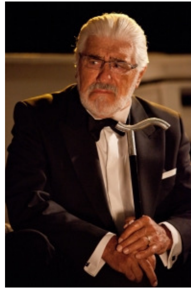
Datei: adk12_Adorf_c_Pauly.jpg Mario Adorf (als Martin Burian) Die lange Welle hinterm Kiel, 2011