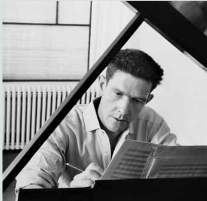
John Cage, 1947. Courtesy of the John Cage Trust

Die einzigartige ästhetische Position des Komponisten John Cage, dessen Werk und theoretische Überlegungen die Musik des 20. Jahrhunderts maßgeblich mitgeprägt haben, wird in einer außergewöhnlichen Konzertserie erfahrbar. Die Kuratoren Eberhard Blum und Erhard Grosskopf laden renommierte Interpreten in den »Raum für John Cage«, der neu mit Partituren und Werkdokumenten installiert ist. Auführungen aus dem Klavier-Œuvre, den Vokalkompositionen und den Werken für Schlagzeug, aller Streichquartette und des Werks für Violine und Klavier lassen hören, wie Cage sich mit den klassischen Formen der Kammermusik auseinandergesetzt hat, demonstrieren in besonderer Weise seine kompositorischen Strategien, seine Arbeit mit dem Gesetzen des Zufalls, seinen konzentrierten Umgang mit dem akustischen Material. Europäische Positionen werden exemplarisch dazu in Beziehung gesetzt; ein Exkurs gilt dem vielschichtigen Verhältnis zu Pierre Boulez, wie es sich im Briefwechsel beider Komponisten widerspiegelt. • Programmkonzept Eberhard Blum