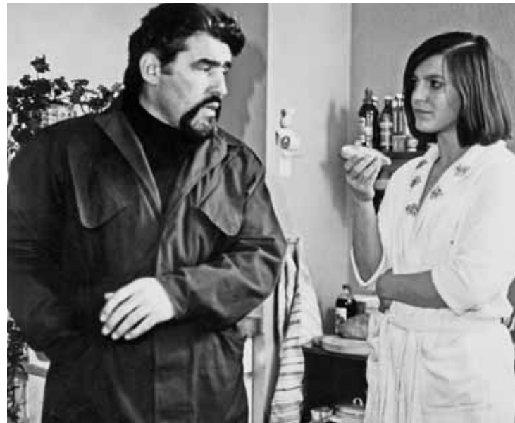
»Die verlorene Ehre der Katharina Blum«, 1975, Mario Adorf, Angela Winkler. Regie Volker Schlöndorff.

Mario Adorf galt im Nachkriegsdeutschland als der Filmbösewicht schlechthin. Nach seiner Charakterstudie des Triebmörders Lüdke in »Nachts, wenn der Teufel kam« (1957) legten ihn die europäischen Western und die italienischen Mafiafilme auf den Typ des brutalen Schurken fest. Doch Adorf entzog sich diesem Klischee. In internationalen Filmen von Jerzy Skolimowski, Robert Enrico oder Claude Chabrol bewies er seine Wandlungsfähigkeit und profilierte sich als Charakterdarsteller. Autorenfilmer wie Edgar Reitz, Michael Verhoeven, Reinhard Hauff, R. W. Fassbinder und Volker Schlöndorff besetzten ihn mehrfach, so in »Die Blechtrommel« (1978/79). Später spielte Adorf in populären Fernsehmehrteilen wie »Via Mala« (1985) oder »Der große Bellheim« (1992). Die Ausstellung verdeutlicht diese Entwicklung und den Facettenreichtum von Adorfs Spielweise. Erstmals werden Fotos und Dokumente aus seinem persönlichen Archiv, das die Akademie der Künste übernommen hat, gezeigt. Mit freundlicher Unterstützung der Gesellschaft der Freunde der Akademie der Künste